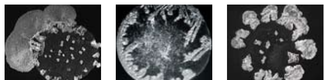
Kristallisate von Blut, Urin und Speichel

Als Vergleichsbasis steht eine enorm umfangreiche Datenbank der Clusteranalytik zur Verfügung. Mittlerweile sind über 150.000 feste Korrelationen zwischen Kristalltexturen und einem medizinischen oder biologischen Begriff geprägt.