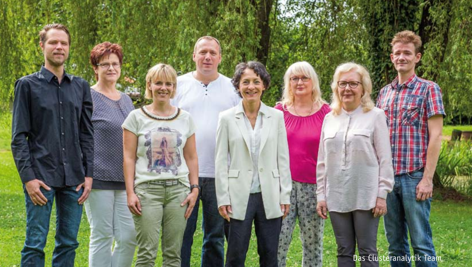
Das Clusteranalytik Team